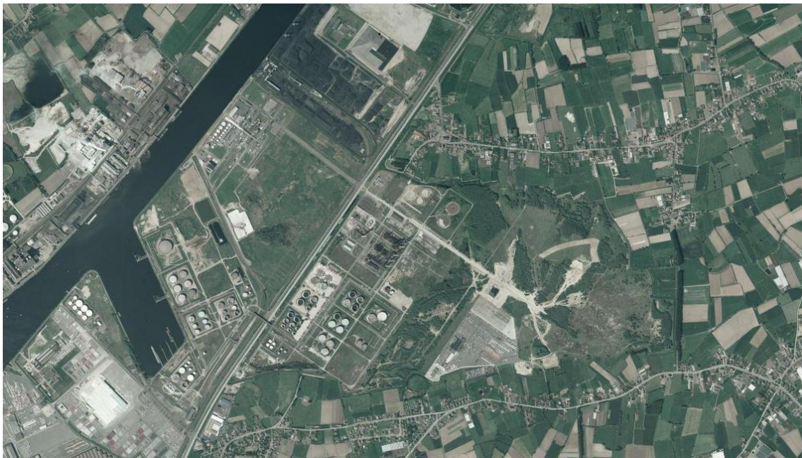
Figuur 4: Bron: www.geopunt.be (23 augustus 2023) – Luchtfoto genomen tussen 1970 en 1990 – Buurtwegen in kwestie zijn hierop niet meer zichtbaar.