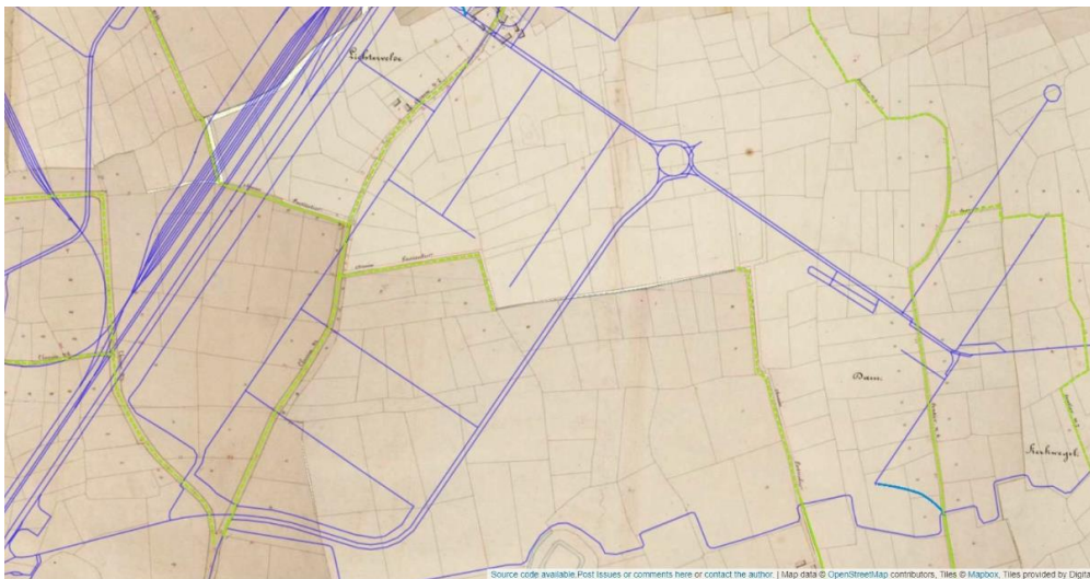
Figuur 1:

Legende: - Groene stippellijn: buurtwegen