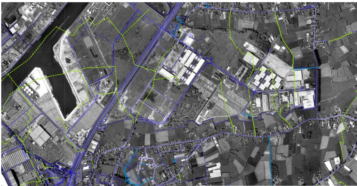
Figuur 5: Bron: NGI Ortho 1995 – Buurtwegen in kwestie zijn hierop niet meer zichtbaar.