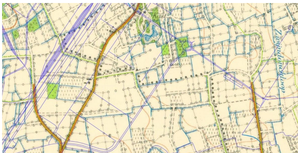
Figuur 2: Hierop is te zien hoe de buurtwegen in 1939 geïntegreerd waren in het weggennetwerk.