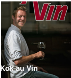
Kok au Vin